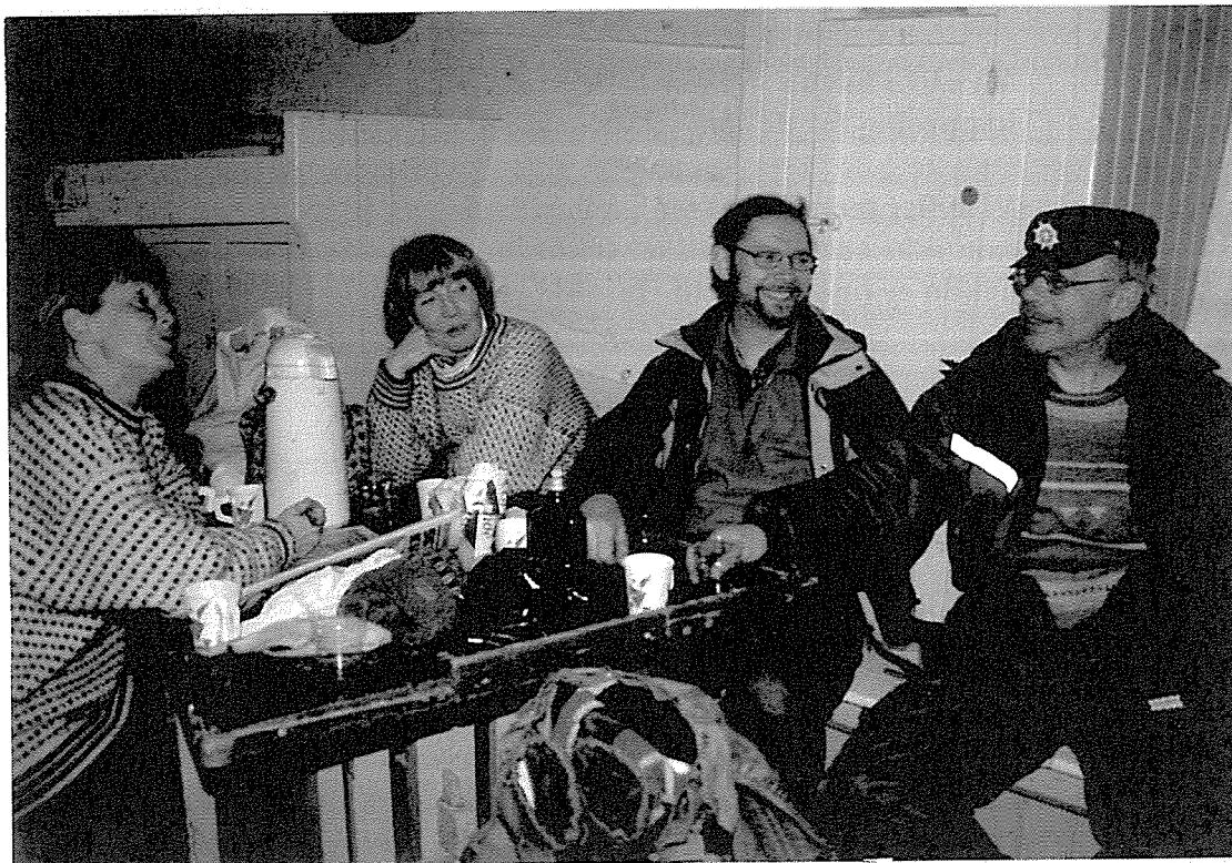
En lystig gjeng på tur til Lofoten